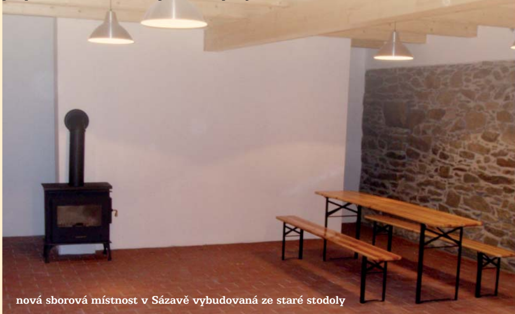
nová sborová místnost v Sázavě vybudovaná ze staré stodoly